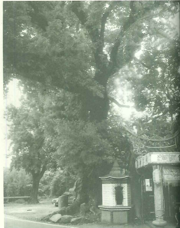
陽光撒落在百年楓香老樹的枝葉，顯得金碧輝煌。

為推動樹興里的產業再造，許里長亦嘗試在樹林口溪畔山谷之農地推廣有機農業，目前已獲得一些農戶之支持，準備試作。從許里長的積極作為里內居民逐漸凝聚生態復育或有機農業的共識的努力，我們有理由相信，樹興里在不久的將來，會是淡水地區自然生態和在地人文的重鎮。