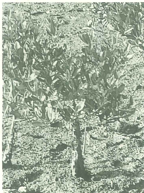
水筆仔四季常綠，看似無際的海上森林。

日常的活動空間。同時，建議地方政府與鄰近之社區組織與國中小學鄉土教育相結合，作為進步城市之「生態」理念的培育地及具有地方特色的生態教學博物館。