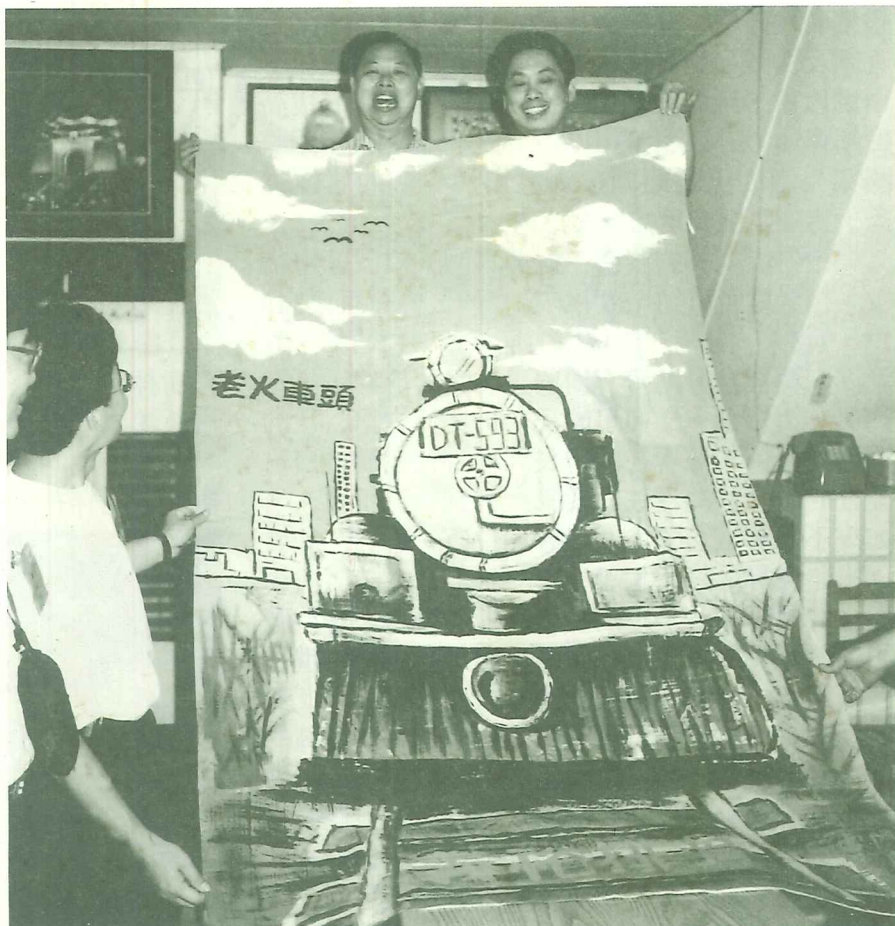
義裕排骨店參加87年度文化賽旗活動，經票選獲得「印象深刻」獎項之作品—老火車頭。

再過幾十天，新夏的時節裡，咱淡水的文化五月天，將是龍旗競飄，馨香酬祖師的文化芬芳時！