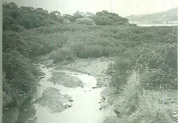
海河交接的沼澤溼地是水鳥棲息覓食最佳之處

87年度營建署擴大內需方案「淡水河口地帶(淡海至關渡)沿岸河川高灘地環境景觀規劃設計」案，於88年6月完成規劃報告。報告中，建議