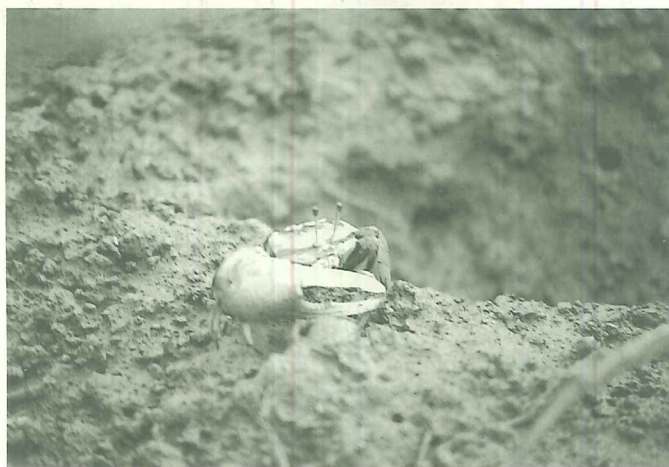
招潮蟹通常在潮水剛退時出沒，此時是觀察的最好時機

將高灘地規劃為自然生態公園，並藉由自行車道的連接計劃，往北連接至淡水市街，往南連接到關渡自然公園，使其成為大台北都會區居民日常生活路徑及生態地域文化與土地經驗重建的起點。依據現況地籍清查，除了目前捷運施工便道之外，該地段90%以上為私有地，基於土地取得之經費及手續較為複雜繁長，因此該規劃案將捷